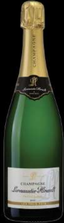
LES TROIS PUY LARNAUDIE HIRAUT

Champagne delicato ed equilibrato, maturato sui lieviti per 24 mesi. Esprime tipiche nuance di fiori bianchi, frutta e crosta di pane. Gusto vivace, minerale e rinfrescante.