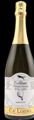
2015 CA' LOJERA TUR BLANC

Colore giallo paglierino con perlage fine. Profumo ricco ed elegante, con sentori di agrumi, frutta matura, miele e nocciole. Gusto secco, asciutto, energico e verticale, di vibrante freschezza.