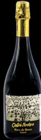
CASTEL NOARNA BLANC DE BLANCS

Dosaggio Zero BIO* Giallo paglierino con aromi floreali e di frutta gialla. Eleganti profumi autolitici. Bollicina è fine e cremosa.