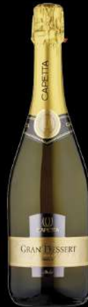
GRAND DESSERT CAPETTA

Vino spumante dolce con un perlage fine e persistente, dissetante. Ideale per accompagnare ogni tipo di dessert.