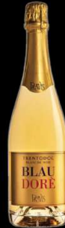
BLAU DORE' PRAVIS

Giallo paglierino, con riflessi dorati; perlage fine e persistente. Al naso si presenta piacevolmente fine; si esprime con sentori di frutta tropicale, note minerali e cenni fragranti. Al palato si rivela fresco, sapido e piacevolmente equilibrato.