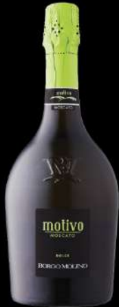
MOTIVO BORGIO MOLINO

Moscato dolce dal colore giallo paglierino brillante, profumo fruttato con note di fiori bianchi e rosa. Fresco, aromatico e frizzante.